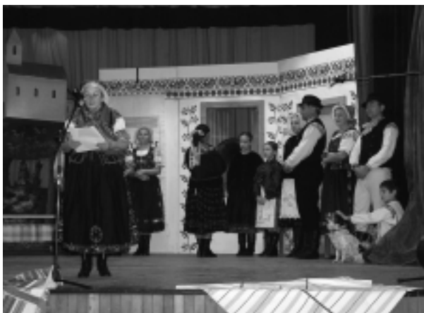
Na úvod vytvorili živý obraz zo zachovanej fotografie, kde nechýbal ani psík.

Béla Bartók strávil veľa času nielen v Dražovciach, ale aj v iných slovenských