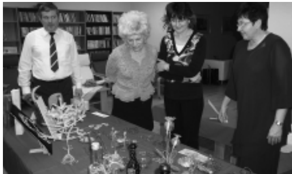
V Centre pre seniorov na Baničovej ulici v Nitre si dôchodcovia mohli pozrieť prekrásnu výstavu, ktorá prezentovala tvorivé aktivity občanov v dôchodkovom veku.