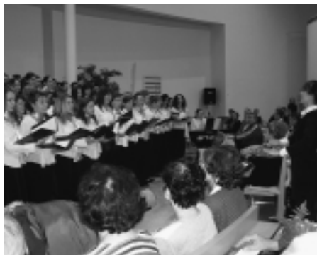
Poslucháči odmenili potleskom aj Akademický spevácky zbor pri UKF Nitra.