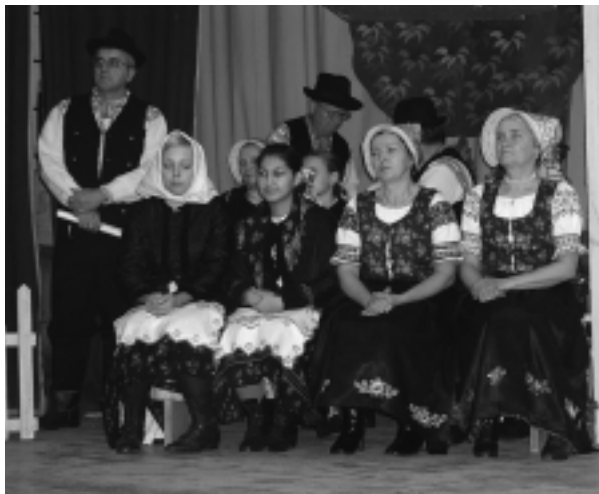
Krása dražovského ľudového odevu v symbióze so spevom tvorili kulisy spomienok na skladateľa B. Bartóka.

obciach ako napríklad v Horných a Dolných Lefantovciach, Sokolníkoch, Lapáši, Klátovej Novej Vsi, Preselánoch pri Nitre a Koniarovciach. Mládež i dospelí mu spievali v dedinách Poniky, Valaská, Kostolné, Hiadeľ, Filiar, Kroka-