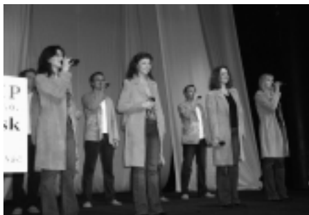
Close Harmony Friends roztlieskala prepĺnenú sálu Starého divadla v Nitre.